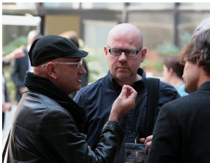
Des réalisateurs et producteurs en pleine discussion