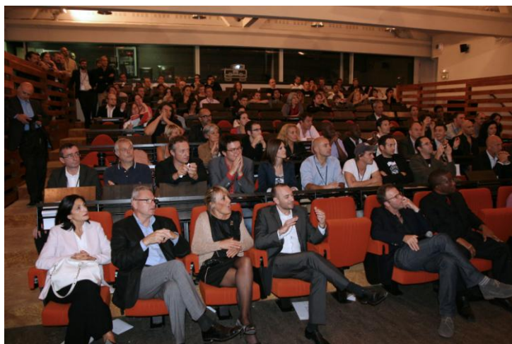
Auditorium de la salle des Archives Municipales – Cérémonie de Clôture

Organisée le samedi 15 à la salle des Archives Municipales, la remise des prix a conclu de magnifique manière ces deux jours de festival et de rencontres. Deux web-séries ont été primées.